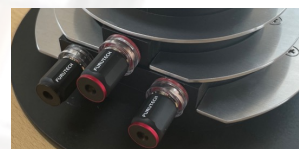
内蔵ネットワークのHi/Lo切り替え端子